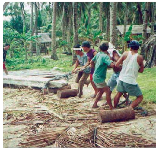
Des blocs de béton destinés à l'édification d'une digue sont coulés et halés par des volontaires communautaires.