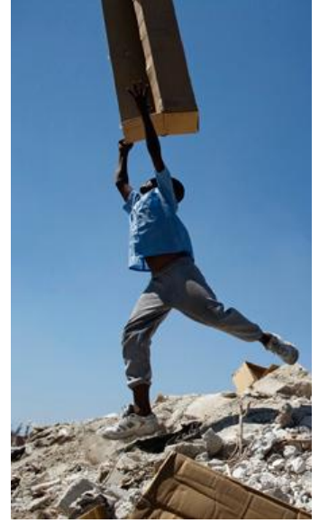
زلزال هايتي، 2010.

من ناحية أخرى، يمكن للقوانين الضعيفة أن تستنزف الثقة العامة، وترسخ طرق تفكير تقليدية وتمكّن ثقافة الخمول. لا بل إنها تجعل مهمة الأفراد الملتزمين بإحداث فرق أصعب بكثير مما يجب أن تكون.