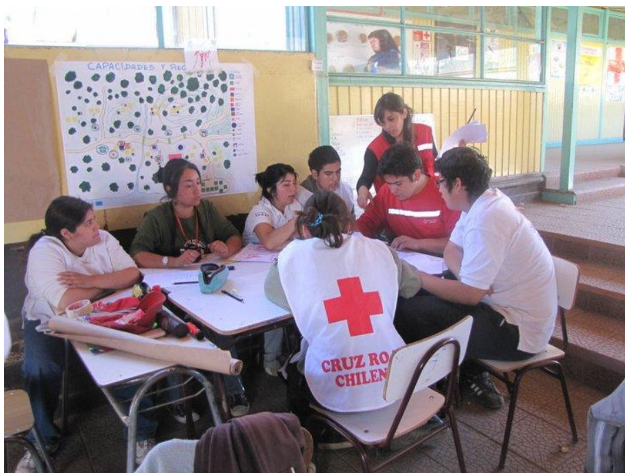
Escuela zonal de Juventud, comuna de Alto Bío Bío, Región del Bío Bío.

Otro de los proyectos bajo el objetivo de fortalecimiento de la Sociedad Nacional, propuesto en el nuevo plan operativo que amplía la operación a 36 meses, consiste en la mejora de infraestructura a través de reparación y remodelación de las instalaciones, la ampliación y modernización de la red de informática y telecomunicaciones de la Cruz Roja Chilena.