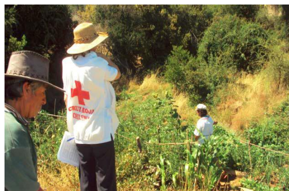
Realización de encuestas para selección de beneficiarios en la comuna de San Carlos, Región del Bío Bío.

A finales del mes de diciembre se realizó la entrega de equipos agrícolas para la cosecha y cultivo de miel, los cuales fueron entregados a una asociación compuesta por nueve apicultores de la comuna de Coronel de Maule, Región del Maule. Posteriormente en enero y febrero, se comenzó a realizar un catastro de comunidades para seleccionar a los próximos beneficiarios. En los meses próximos se estará sistematizando esta información para realizar las evaluaciones correspondientes. El resumen de las encuestadas realizadas por región y comuna se presenta a continuación: