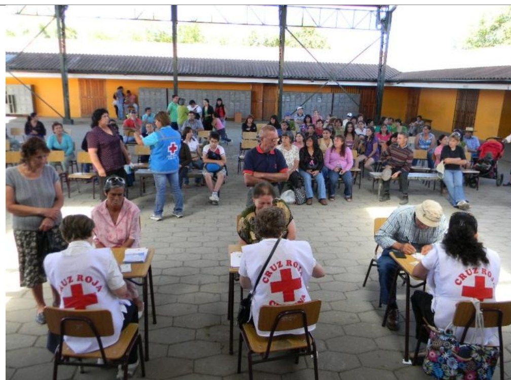
Entrega de Tarjeta RED Construcción, en la comuna de Hualañé, Región del Bío Bío.

Llamamiento de emergencia n° MDRCL006 GLIDE n° EQ-2010-000034-CHL Actualización de operaciones n° 11 26 de abril de 2011