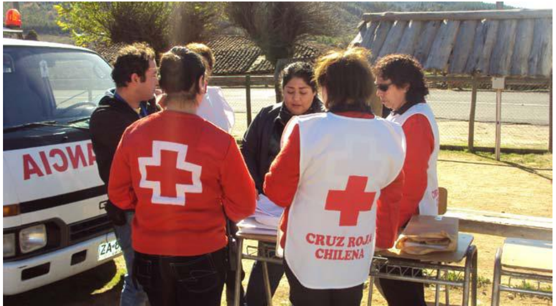
Voluntarios preparando la entrega de los kits de a un grupo de los beneficiarios de la comuna de Quirihue, Región del Bío-Bío.

Cobertura del Llamamiento: 93% <Presione clic aquí para ver informe de la respuesta de donantes actualizado, aquí para ver el informe interino financiero o aquí para ir ver la información de contacto>