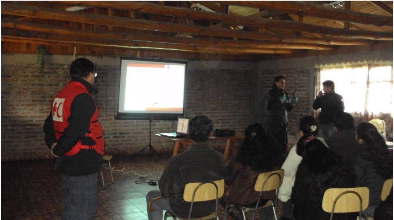
Beneficiarios del kit de semilla y del kit de protección en San Javier recibieron un curso corto sobre el buen uso de los artículos entregados.

Para apoyar y coordinar las actividades realizadas por los voluntarios en el terreno, se han contratado una ingeniera agrícola y dos coordinadores (1 técnico agrícola y 1 técnico agropecuario) uno para la región del Bío-Bío y otro para la región del Maule.