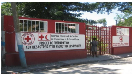
Centre opérationnel de gestion des catastrophes

Une stratégie et un plan d'intervention doté de niveaux de responsabilité clairement définis ont été mis en place pour faire face à une éventuelle nouvelle catastrophe. Le programme a mis en place des systèmes de mécanismes d'alerte, de gestion de l'information et de coordination. Cinq équipes ont été formées aux évaluations de terrain et à l'élaboration de procédures opérationnelles standards afin d'intervenir de manière rapide et efficace en cas de catastrophe majeure durant la saison des ouragans.