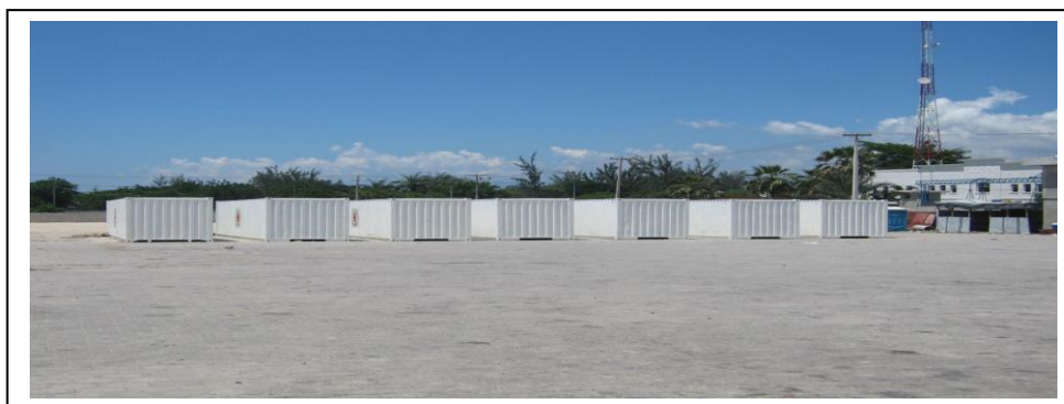
Des unités TMSU à l'entrepôt de Barbancourt (Port-au-Prince)

Quinze conteneurs de 40 pieds et treize conteneurs de 20 pieds ont été achetés, transportés et adaptés pour en faire des Unités tropicales mobiles de stockage (TMSU) afin de renforcer la capacité de stockage de la Société nationale. Ils seront disponibles pendant plusieurs années et augmenteront la capacité d'intervention de la Croix-Rouge haïtienne dans les sections régionales éloignées.