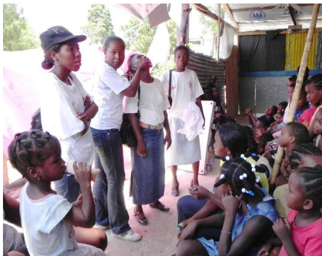
Démonstration de gestes élémentaires vitaux dans un camp de déplacés internes à Port-au-Prince

Le déploiement de volontaires formés (28 travaillant dans des camps et 26 de sections régionales) à l'hygiène communautaire, à la promotion intégrée de la santé et à la préparation pour faire face aux épidémies a servi de base pour de premières actions d'urgence concrètes adoptées au niveau communautaire durant les premières semaines de la flambée de choléra. Un mécanisme de retour d'information des bénéficiaires par le biais de moyens de communication de masse (radio, télévision, SMS et affiches) a été développé.