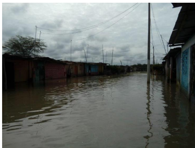
Una calle inundada en el departamento de Piura.

Las inundaciones han generado un impacto a nivel nacional en los 24 departamentos, particularmente en las zonas afectadas, actualmente se tienen registrado 665.313 personas afectadas, 145.821 viviendas afectadas, 12.378 viviendas colapsadas, 13.075 viviendas inhabitables, 79 muertos, 267 heridos y 21 desaparecidas. Las lluvias continúan en varias zonas del país y han afectadas a 1.202 centros educativos y 400 centros de salud, causando los colapsos de 31 centros educativos, 10 centros de salud y dejando 68 centros educativos y 17 centros de salud inhabitables 1 . Los departamentos más afectados son Piura, Tumbes, Lambayeque, y La Libertad.