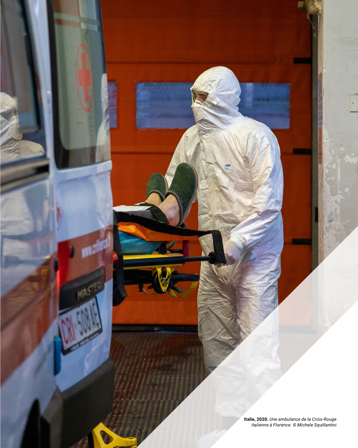
Italie, 2020. Une ambulance de la Croix-Rouge italienne à Florence.