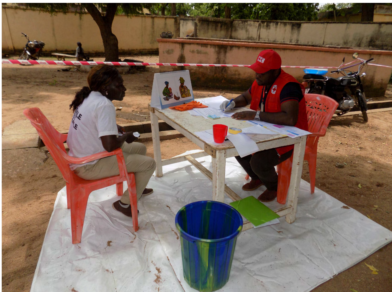
Formation théorique et pratique des volontaires CP3 de la Bénoué, Région du Nord Cameroun. Croix-Rouge camerounaise / 2019