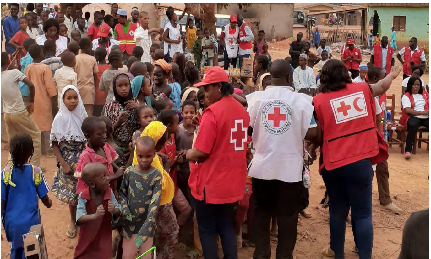
Séance pratique de cinéma mobile dans la communauté de Mandjou (Bertoua, Région de l'Est).