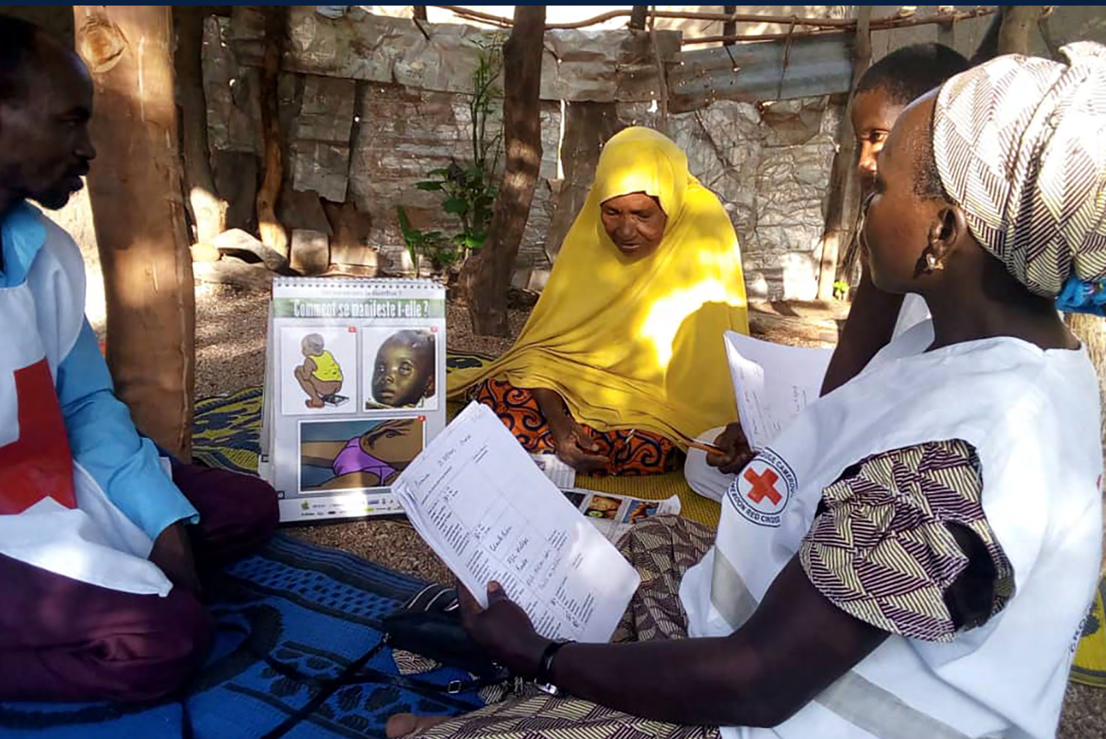
Sensibilisation par les volontaires de la Croix-Rouge camerounaise sur les maladies diarrhéiques dans la Bénoué, région du Nord.