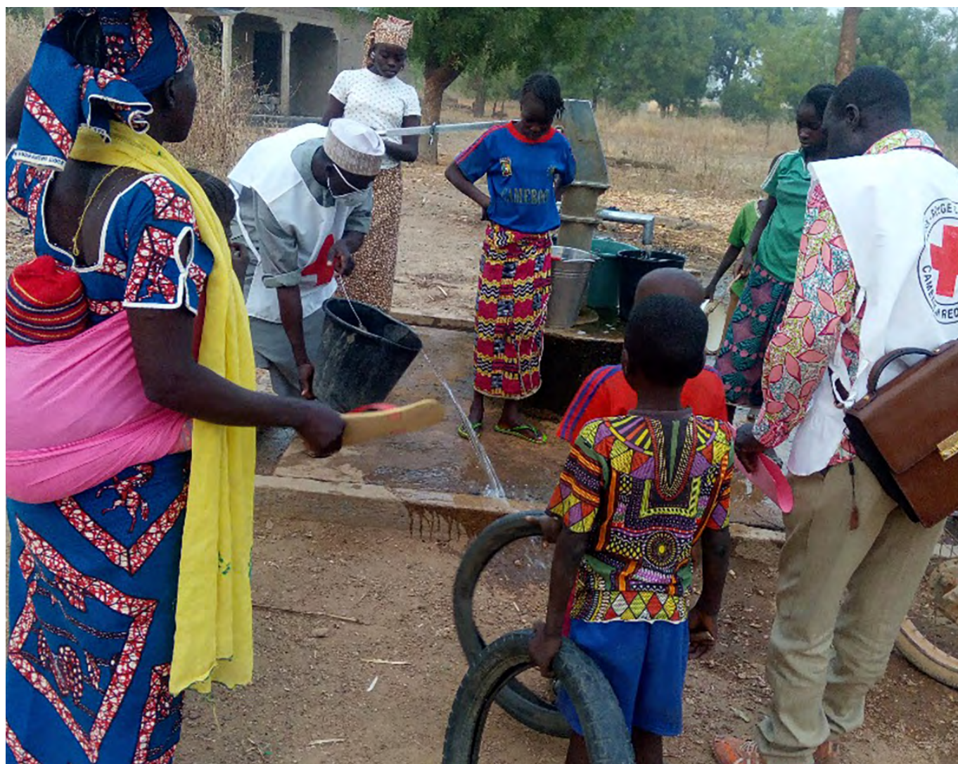
Sensibilisation aux risques et aux bonnes pratiques d'hygiène dans la communauté à Bibemi, région du Nord.

Les plans de contingence régulièrement mis à jour facilitent une riposte rapide à travers un schéma préétabli, la bonne coordination entre partenaires, ainsi qu'une mobilisation précoce des ressources. La bonne coordination entre le siège et les branches de la Société nationale, l'investissement dans la formation initiale et continue des branches et leur approvisionnement en matériel adéquat sont des bonnes pratiques qui doivent être maintenues et renforcées.