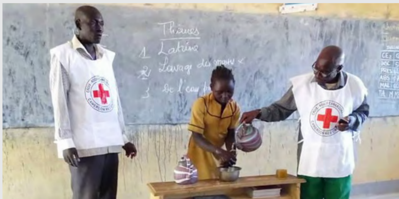
Activité de sensibilisation à l'importance du lavage des mains dans les écoles à Mayo Rey dans la région du Nord Cameroun.

Du 1er au 5 août 2020, la Croix-Rouge camerounaise a fourni un appui au ministère de la Santé dans le cadre de la campagne réactive de vaccination contre le choléra qui a été menée dans les régions du Littoral, du Sud et du Sud-Ouest. Les volontaires de la Société nationale ont soutenu la mobilisation sociale visant à informer les ménages avant la visite des équipes de vaccination et pendant la vaccination elle-même. La Croix-Rouge camerounaise apporte régulièrement un soutien de ce type lors des campagnes de vaccination menées par le ministère de la Santé.