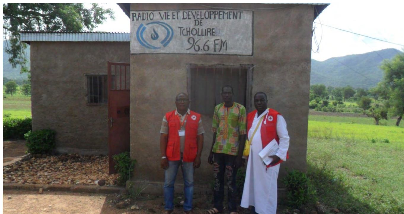
Mobilisation des parties prenantes au Programme de préparation des communautés aux épidémies et aux pandémies (CP3) de la Croix-Rouge camerounaise à Tcholliré, Région du Nord.