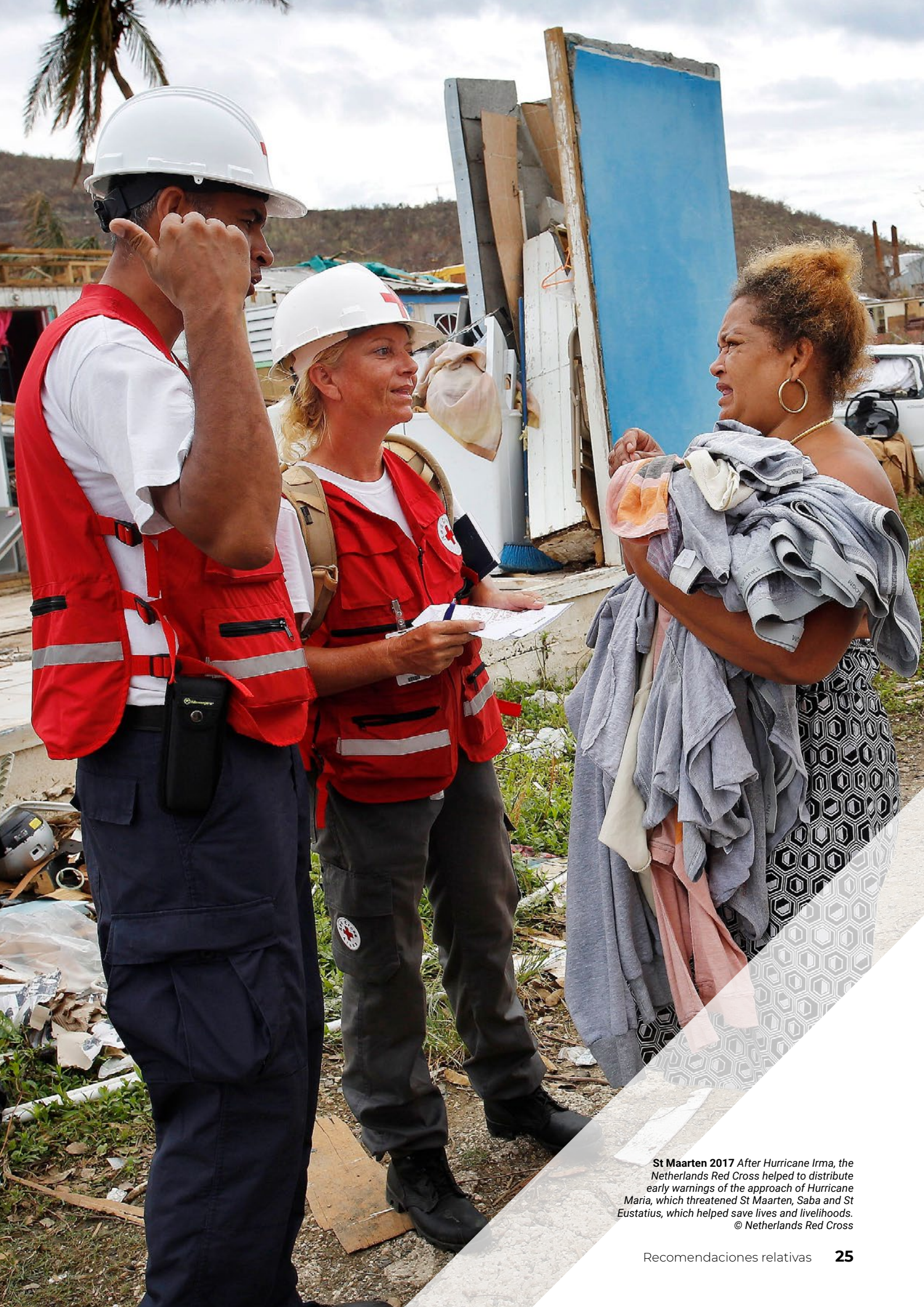
St Maarten 2017 After Hurricane Irma, the Netherlands Red Cross helped to distribute early warnings of the approach of Hurricane Maria, which threatened St Maarten, Saba and St Eustatius, which helped save lives and livelihoods.