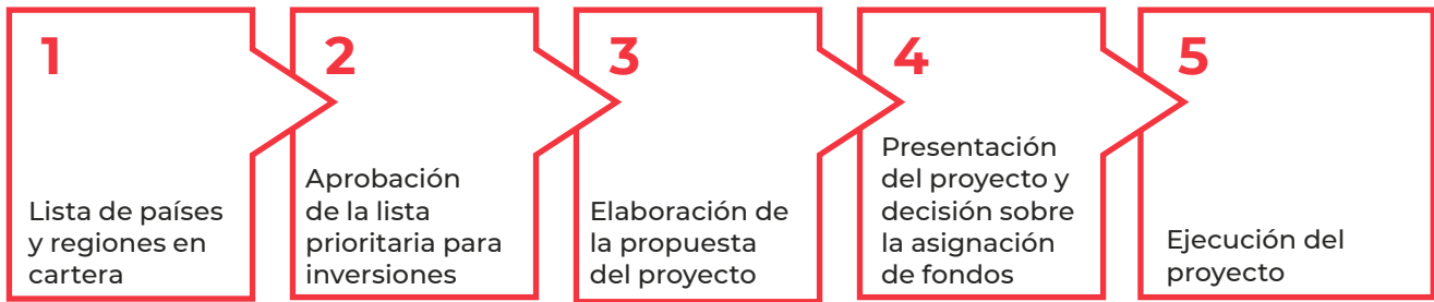
Figure 1 CREWS project development timeline