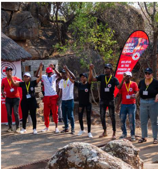
© اجتماع لجنة الشباب التابعة للاتحاد الدولي لجمعيات الصليب الأحمر والهلال الأحمر الذي يستضيفه الصليب الأحمر الزيمبابوي

كثيرا ما تتألف عضوية شبكة الشباب من ممثلين رسميين عن الجمعيات الوطنية. ولكن عندما تكون شبكة الشباب قد أرسيت أساسا متينا بالفعل ونجحت في تحقيق مستويات عالية من المشاركة، ينبغي النظر في توسيع قاعدة العضوية (بما يشمل جميع شباب الصليب الأحمر والهلال الأحمر في المنطقة). وسيتيح ذلك تنمية الشعور بالانتماء إلى الشبكة لدى المزيد من الشباب ويوسع انتشارها.