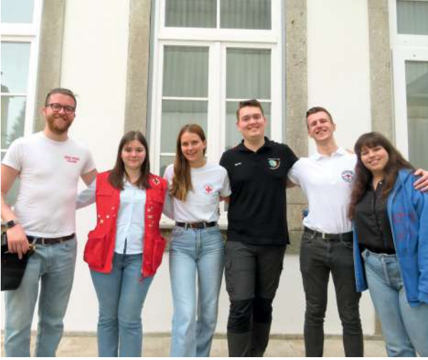
اجتماع تعاون الشباب الأوروبي الذي استضافه الصليب الأحمر البرتغالي