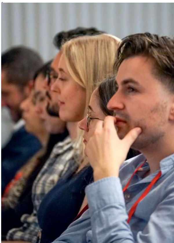
© Reunión de Cooperación Juvenil Europea organizada por la Cruz Roja Portuguesa

Los órganos de gobierno de las redes de la juventud también representan y vinculan a varias regiones y subregiones con la Comisión de la Juventud a nivel mundial. Con la ayuda de la secretaría, esos órganos de gobierno apoyan la labor de la región, mediante la coordinación de la elaboración, la adaptación y la aplicación de estrategias y políticas a escala mundial y la transmisión en cascada de las mismas a las Sociedades Nacionales.