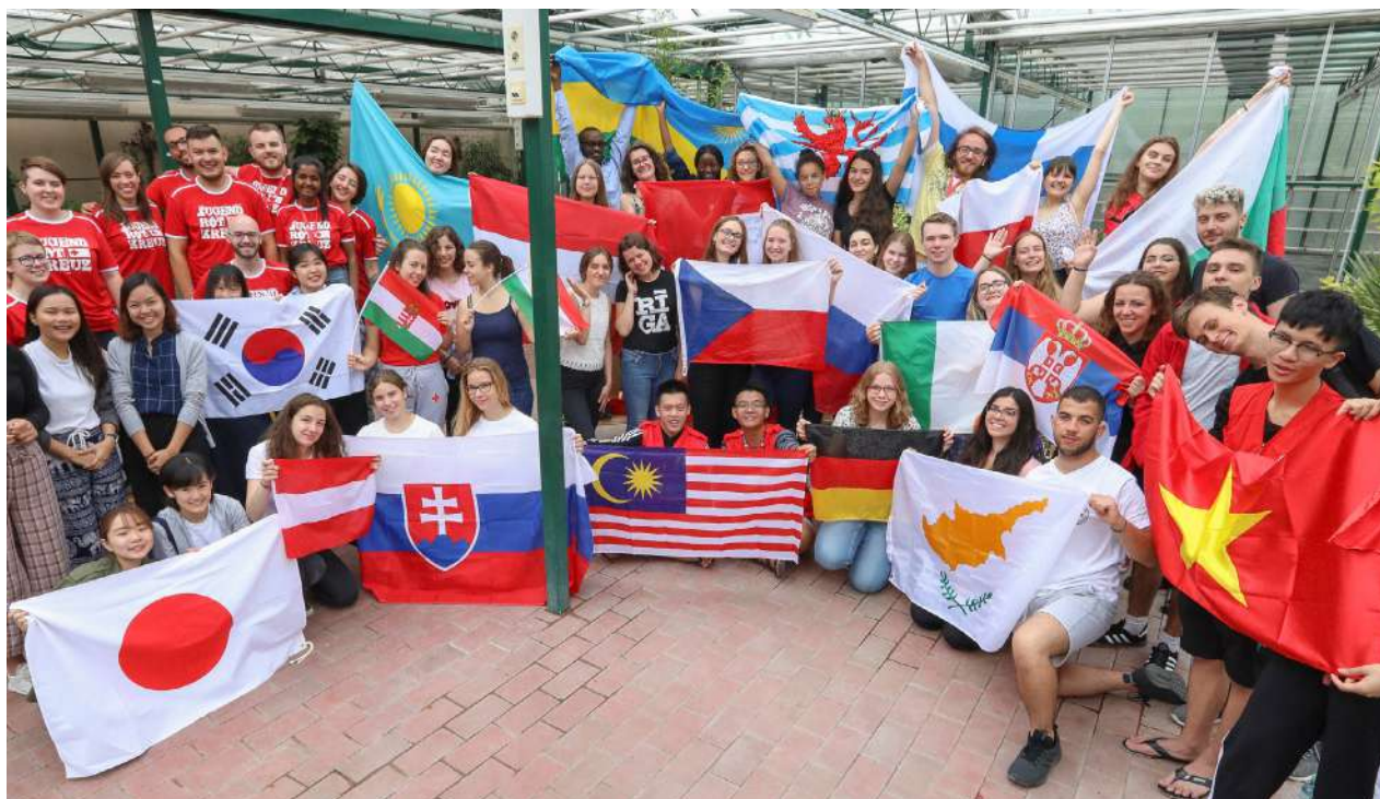
© Campamento Internacional de Amistad de la Cruz Roja Austriaca

La primera parte del documento ofrece ideas extraídas de distintas directrices, y la segunda es un resumen del caja de herramientas.