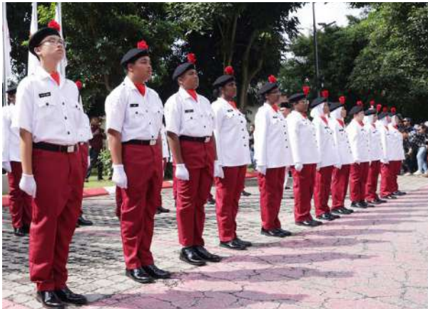
© Media Luna Roja de Malasia