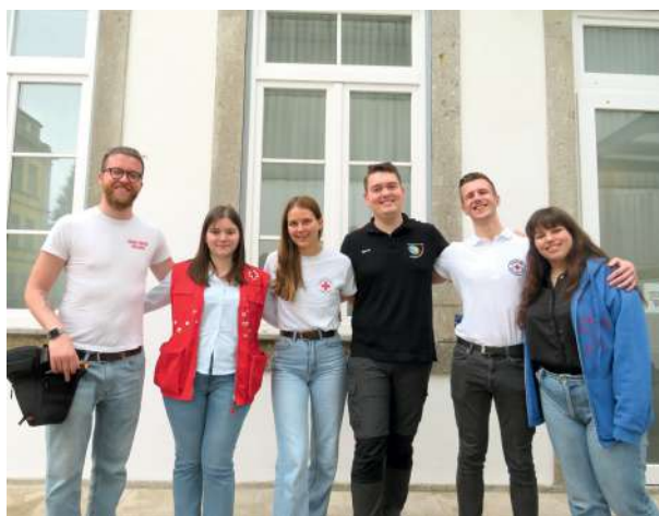
© Reunión de Cooperación Juvenil Europea organizada por la Cruz Roja Portuguesa