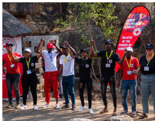
© Reunión de la Comisión Global de la Juventud de la Federación Internacional organizada por la Cruz Roja de Zimbabwe